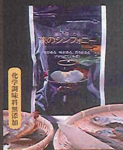
化学調味料無添加